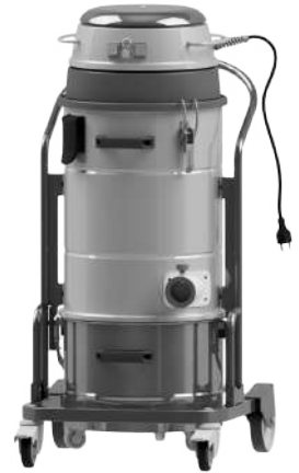
Cuve en inox