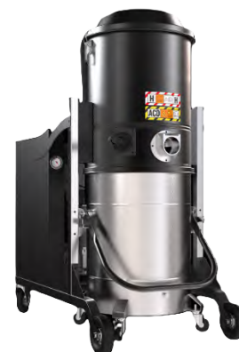
Cuve en inox